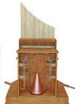
Orgue de Ctésibios

Aulos : extrait du film Agora (Alexandrie, V ème s.) :