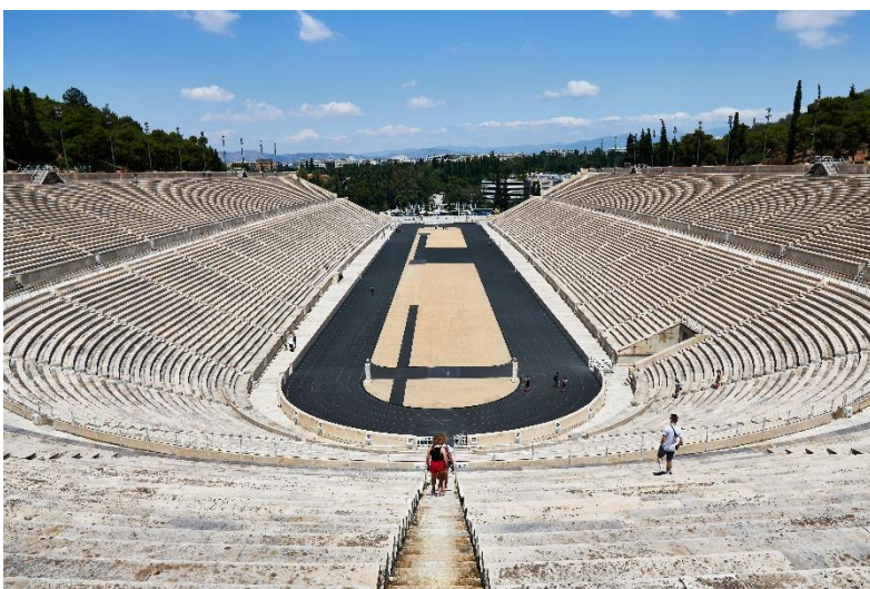
Stade panathénaïque d'Athènes

Sports de combat : pugilat (boxe), lutte et pancrace (lutte où tous les coups sont permis).